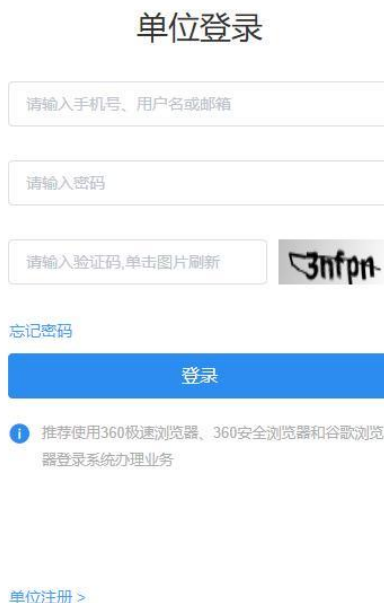
图 2 单位登录