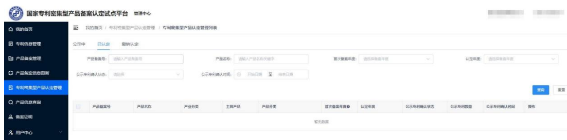
图 7 专利密集型产品认定管理列表页

通过试点平台对 2024 年度专利密集型产品拟认定名单进行公示，公示期满无异议或异议不成立的产品，认定为 2024 年度专利密集型产品，在试点平台上进行公布。相关单位可登录试点平台，在“专利密集型产品认定管理”列表栏下，对已认定的专利密集型产品进行查询、浏览、下载专利密集型产品认定证书。