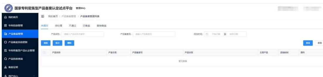
图 5 产品备案列表页

左侧列表点击“产品备案管理”菜单，进入产品备案管理列表页面。在“未提交”列表页下，点击“填报”按钮，进行产品备案填报，提交等待系统审核。试点平台系统对产品备案信息进行形式校验，备案通过后单位下载备案证明；若备案未通过，则单位需重新修改产品信息再次提交审核。