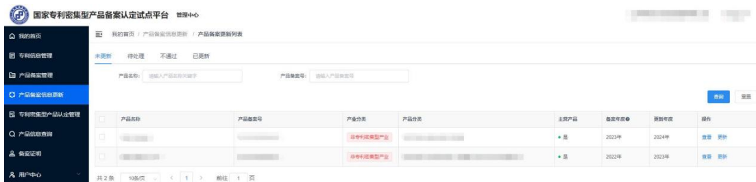
图 6 产品备案信息更新列表页

2023 年及以前备案通过的产品，须进行已备案产品信息更新，未进行备案信息更新的往年产品，不能参与本年度专利密集型产品认定工作。单位点击“产品备案信息更新”菜单，进入产品数据更新页面，在“未更新”下，单位需更新已备案产品新一年的经营数据，并确认该产品信息和关联专利信息是否发生变化，根据实际情况进行修改和更新，提交等待系统审核。试点平台系统对备案产品更新信息进行形式校验，若更新未通过，则单位需重新修改产品信息再次提交审核。